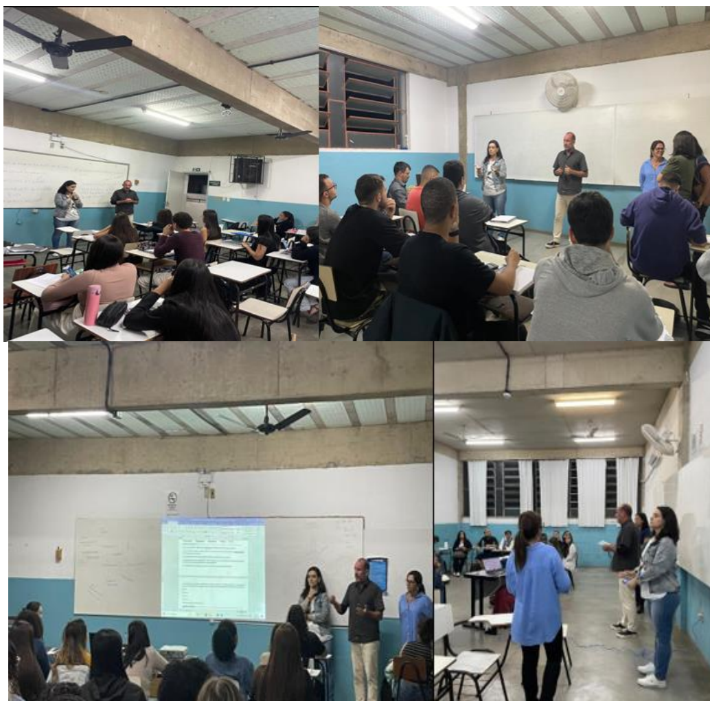
Campanha de Sensibilização em Sala de Aula

A Comissão Própria de Avaliação (CPA) desenvolve suas atividades orientada pelo lema " Avaliar para melhorar: sua participação faz a diferença ".